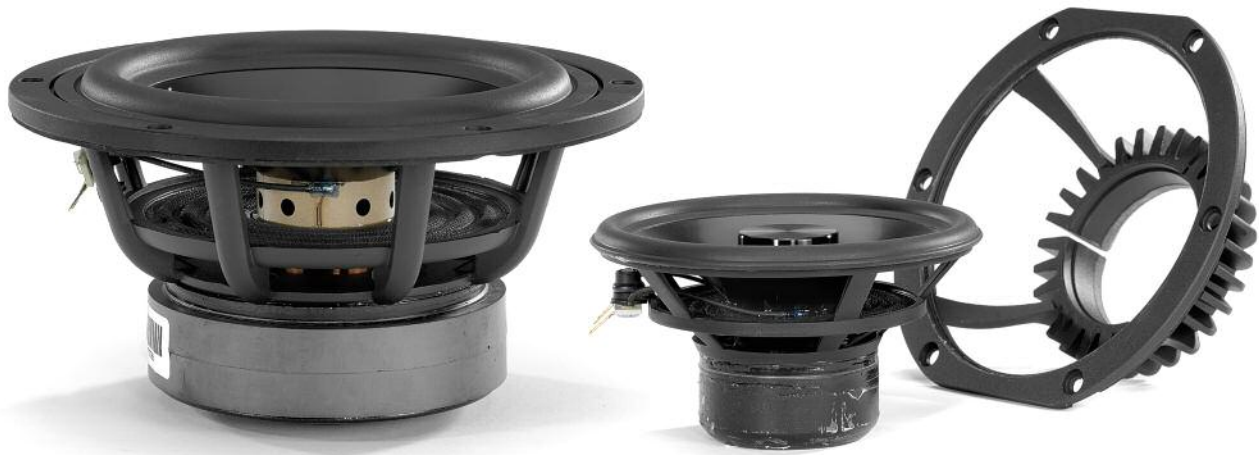
Alle Treiber werden zwar extern gefertigt, aber intern entwickelt. So lassen sich auch Sonderwünsche wie ein Korb-in-Korb-System aus verschiedenen Materialien realisieren

tuelle Bühne, je stärker der Winkel, desto plastischer und präsenter die Instrumente in der Stereo-Mitte. Am Ende kam ich an den Punkt, wo sich das Gefühl einstellte, von meinem Hörsessel aus direkt in die Aufnahme-Sitzung zu gucken. Da stimmte alles – übrigens auch tonal: Werfen Sie alle Vorurteile über den hellen Klang von Aluminium-Konussen über Bord, ich habe es angesichts der „Farbechtheit“ von Flöte, Klarinette, Oboe, Horn und Fagott auch getan. Die Virgo 25 plus+ klingt weder hell noch dunkel, weder warm noch kalt, sondern – faszinierend realistisch und gerade bei natürlichen Instrumenten wunderschön.