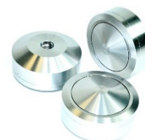
LEVIS - Novità!